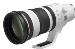
RF100-300mm F2.8 L IS USM (カメラ用交換レンズ)