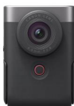
PowerShot V10 (Vlog カメラ)