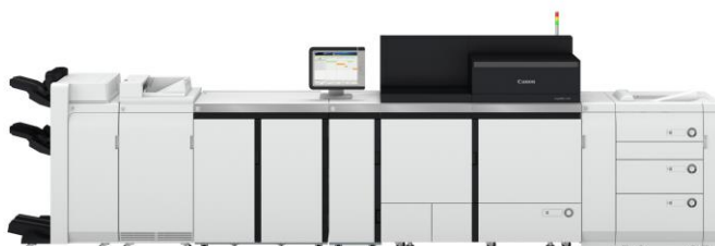
imagePRESS V シリーズ (商業印刷向けカラープロダクションプリンター) * 写真は imagePRESS V1350