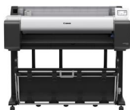
imagePROGRAF TM シリーズ (大判インクジェットプリンター) * 写真は imagePROGRAF TM-355