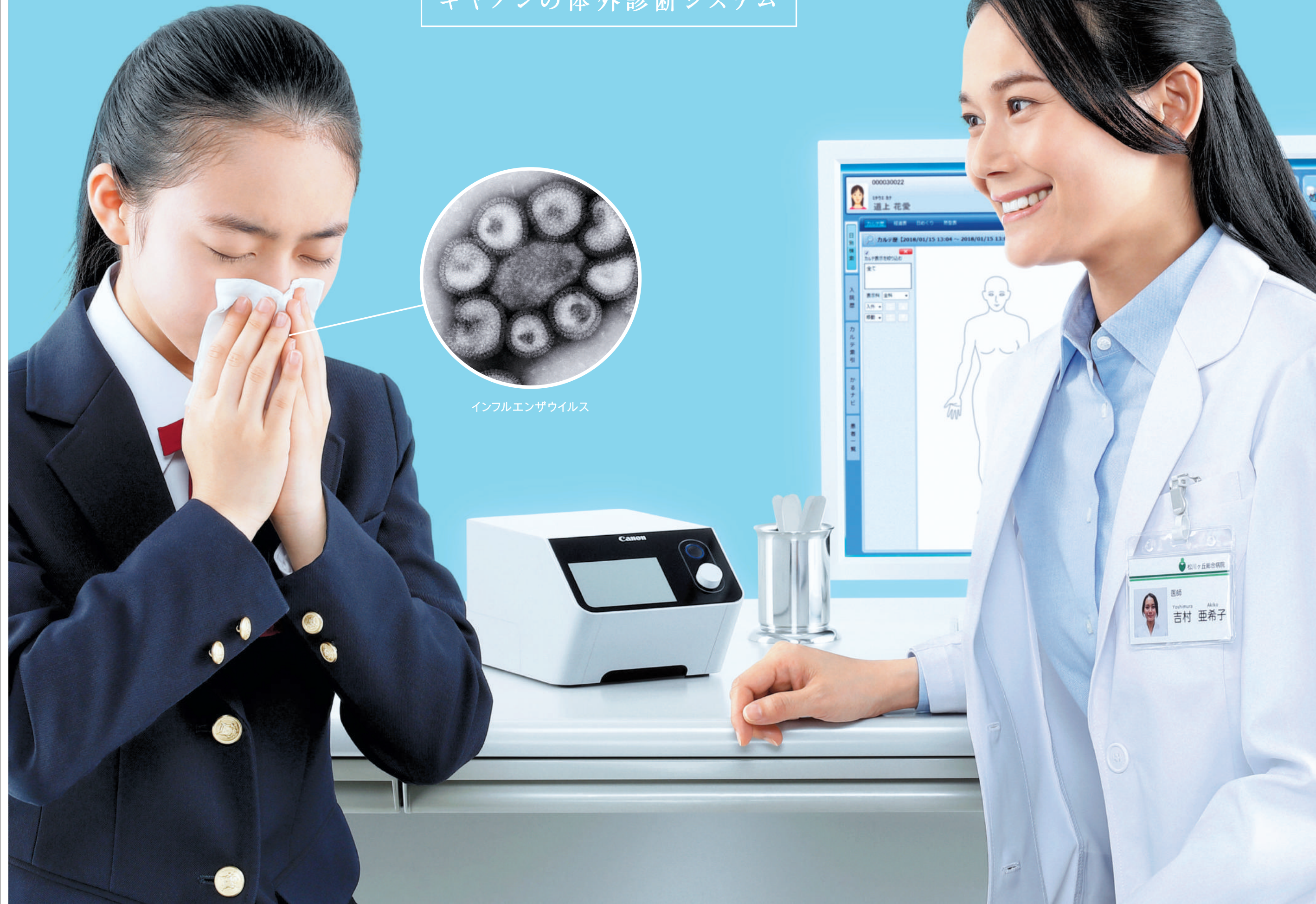
インフルエンザウイルス