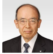
代表取締役副社長 CFO