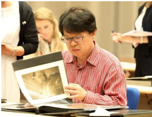
審査の様子（昨年度の優秀賞選出審査会にて）

キヤノンは、新人写真家の発掘・育成・支援を目的とした文化支援プロジェクト「写真新世紀」の2019年度（第42回公募）の募集を4月17日（水）より開始します。国内外から審査員を招へいし、グローバルな写真コンテストを推進しています。