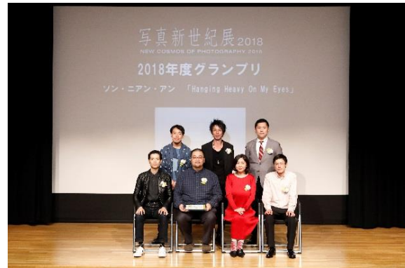
昨年度の優秀賞受賞者7名