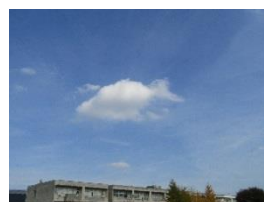
「空の水そう」埼玉県上里町 小学5年生の作品