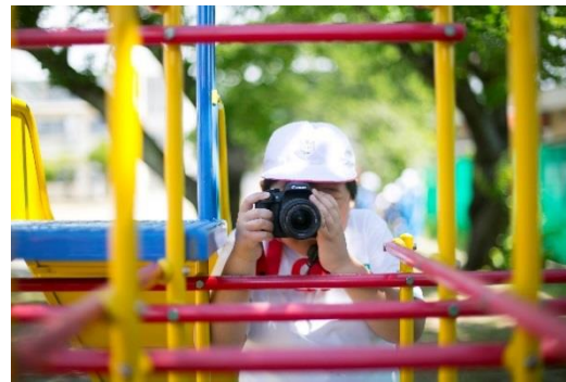
自然の中で撮影を楽しむ子どもたち（昨年度の撮影会の様子）