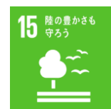
ゴール 15 「陸の豊かさも守ろう」

今年の写真教室においては、ジュニアフォトグラファーズが15周年を迎えることにちなみ、持続可能な開発目標（SDGs）のゴール15「陸の豊かさも守ろう」をテーマとして盛り込み、陸地、緑、植物など身近な自然や環境の大切さを見つめ直す機会を提供します。