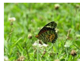
「お花の上で蜜を飲んで休憩」 宮崎県五ヶ瀬町 小学2年生の作