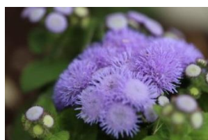
「むらさき色のホワホワの花」 宮城県仙台市 小学6年生の作