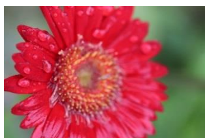
「水がついた花」 鹿児島県大和村 小学6年生の作品