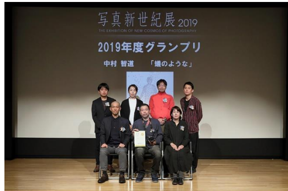
昨年度の優秀賞受賞者7名