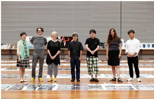
審査の様子（昨年度の優秀賞選出審査会にて）

キヤノンは、新人写真家の発掘・育成・支援を目的とした文化支援プロジェクト「写真新世紀」の2020年度（第43回公募）の募集を3月18日（水）に開始します。国内外から審査員を招き、グローバルな写真コンテストを推進しています。