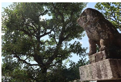
「自然を見守るこま犬」 小学3年生の作品