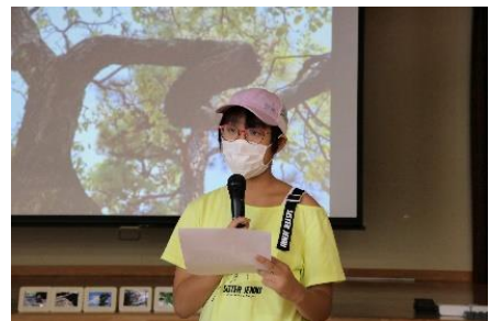
作品発表会の様子

* オンライン形式での開催の場合、参加校・団体とジュニアフォトグラファーズ事務局をオンラインで接続し、「デジタルカメラ教室」と「作品発表会」を実施します。「撮影会」と作品発表会における「プリント」は、参加校・団体でご対応いただけます。事前に必要機材をキヤノンからお送りし、操作方法などをご説明します。