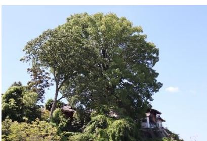
「でっかいプロックリー」 小学5年生の作品