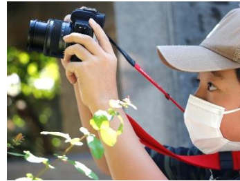
自然の中で撮影を楽しむ子どもたち（過去に実施した撮影会の様子）