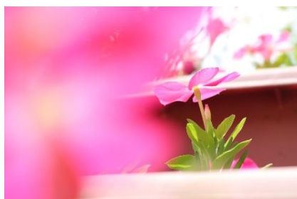
「ひよこりピンクのお花」 小学6年生の作品