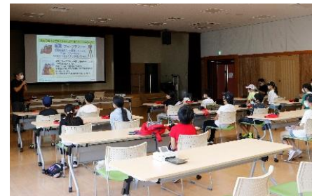
デジタルカメラ教室の様子