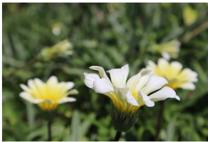
「白く輝く花」 小学6年生の作品