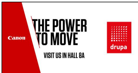
ブースコンセプト「The Power to Move」

キヤノンは、2024年5月28日（火）から6月7日（金）まで、ドイツ・デュッセルドルフで開催される「drupa 2024」に出展し、商業印刷から産業印刷まで幅広いプロダクションプリンティング分野における新製品と先進の印刷ソリューションを紹介します。