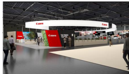
キヤノンブースイメージ

キヤノンは、アナログ印刷からデジタル印刷へのシフトにより大きな成長が見込まれる商業印刷・産業印刷分野において、グループ会社のキヤノンプロダクションプリンティング（旧オセ）とのシナジーを発揮しながら、プリンティンググループの総力をあげて製品ラインアップの強化・拡充を進めています。「drupa 2024」では、「The Power to Move」をコンセプトに、印刷事業者の多様なニーズに応える最新の印刷機やソリューションを紹介します。人々に感動を与え、ビジネスを促進する「印刷の力」を提案することで、お客様の経営課題解決と持続的な成長に貢献します。