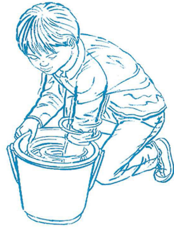
バケツの水をかき回します。