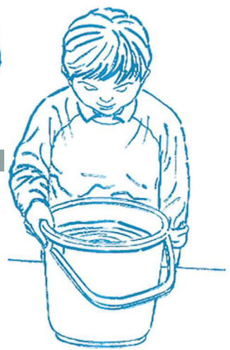
水の回転が収まるまで、しばらく観察を続けます。